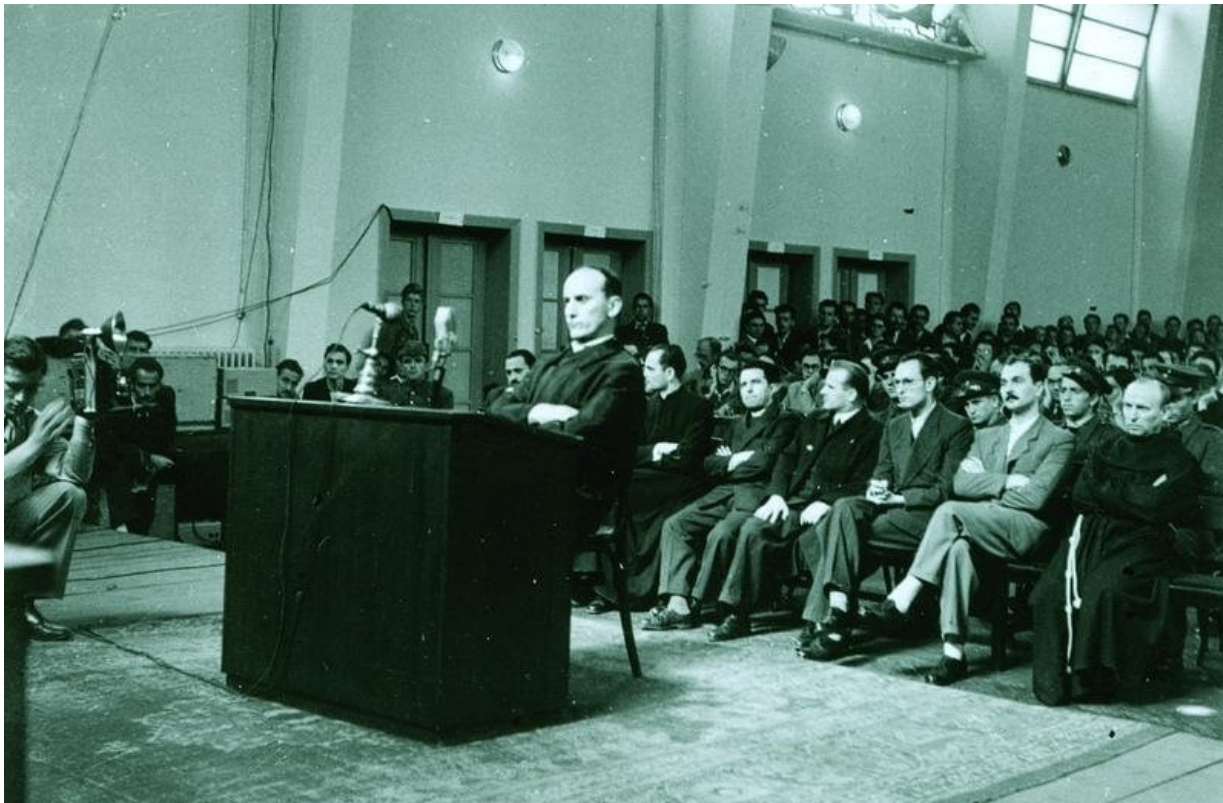
Nadbiskup zagrebački Alojzije Stepinac na optuženičkoj klupi