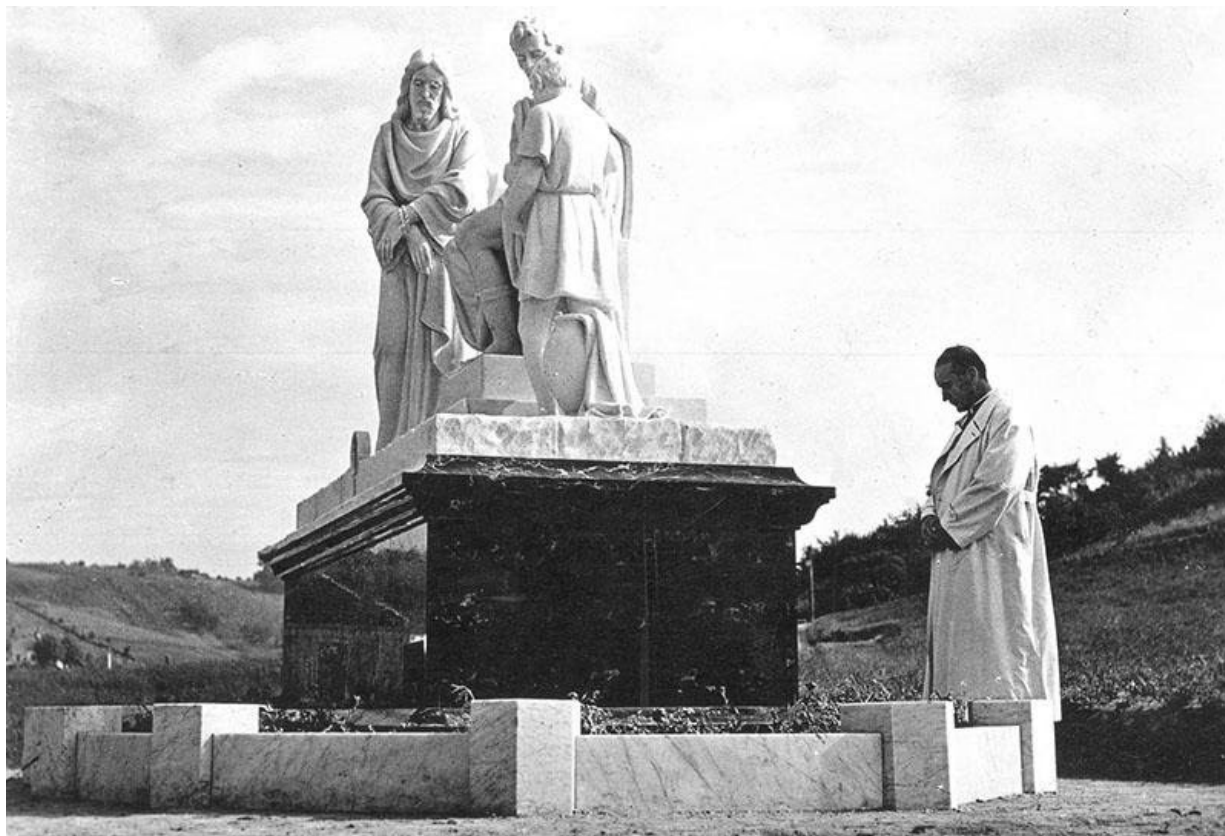
Nadbiskup Stepinac na Križnom putu u Mariji Bistrici 1943.