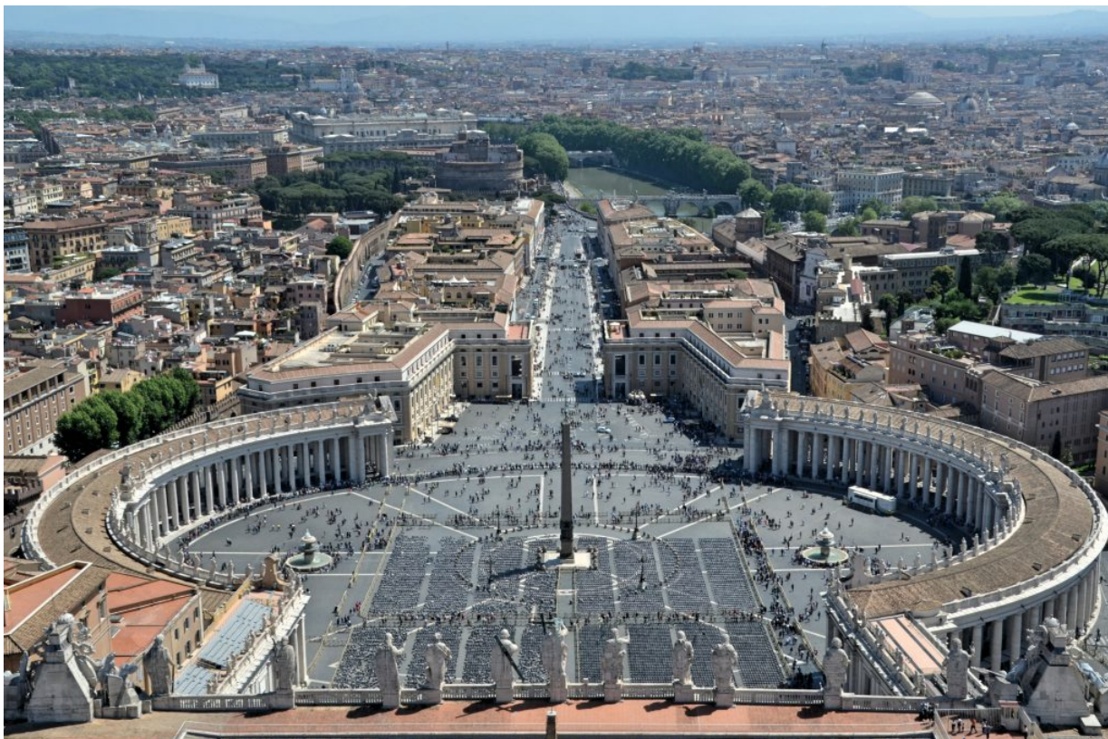
Trg svetog Petra u Rimu