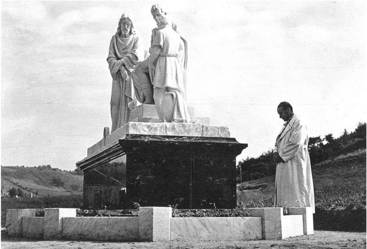
Nadbiskup Stepinac na Križnom putu u Mariji Bistrici 1943.