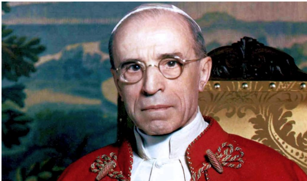
Papa Pacelli potomak je starog rimskog plemstva koje je dalo niz istaknutih pravnika