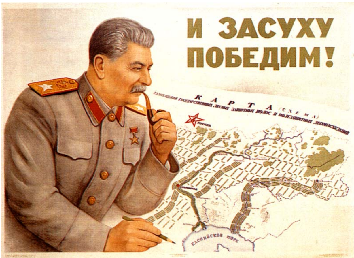
Sovjetski vođa i komunistički diktator Josif Visarionovič Staljin

jednom vrlo zamršenom i dramatičnom razdoblju u povijesti Katoličke Crkve. Osim djelovanja protiv hitlerizma, Pio XII. je imao veliku ulogu nakon rata u zaustavljanju prodora komunizma u Italiju, gdje se aktivno uključio u politički život na strani Democrazia Cristiana protiv snažnog talijanskog komunističkog i revolucionarnog pokreta, ali i svojim beskompromisnim držanjem i podrškom Mindszentyu i Stepincu i odbijanjem svećeničkih udruženja pod kontrolom države zaustavio je prvi i snažni udar na Istočne katoličke crkve. Upravo u trenucima najvećeg pritiska komunističkih režima papa Pio XII. je bio beskompromisni borac u obrani crkvenog nauka i prava Crkve pod komunističkim režimom. Iako je taj otpor značio golemu žrtvu, ipak je on bio presudan za opstanak katoličanstva pod komunističkim režimima. Veliki udarac infiltraciji komunizma dao je odlukom 1949. godine da se svaki katolik koji se učlani u komunističku stranku automatizmom izopći. Vjerojatno je ona donesena pod snažnim dojmom negativnih vijesti s Dalekog istoka gdje je provedena kineska revolucija koja je u toj značajnoj zemlji uništila cvjetajuće kršćanstvo.