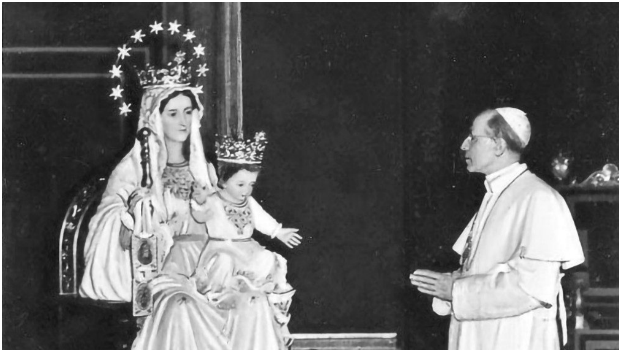
Papa Pio XII. je snažno promicao pobožnost prema Blaženoj Djevici Mariji

to da se ne smije naivno vjerovati da može postojati nekakvo „spiritualno“ kršćanstvo lišeno svake realnosti života. Nemoguće je odvojiti njegov politički i diplomatski rad od njegove duhovne karizme i svetosti života, kako bi htjele takve interpretacije. Njegovo snažno promicanje pobožnosti prema Blaženoj Djevici Mariji je imalo i duhovno poslanje, ali istodobno i poslanje borbe protiv ateističkog komunizma, jer je on borbu s komunizmom shvaćao kao duhovni rat te je tako htio borbu katolika diljem svijeta protiv komunizma staviti pod zaštitu Majke Božje, što se može jasno vidjeti iz njegovih enciklika poput one iz 1954. naslovljene Ad coeli reginam .