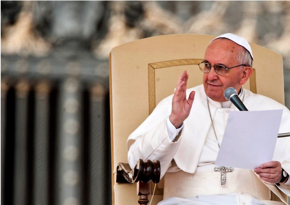
Nema sumnje da Papa ima sveti cilj pred sobom i da nema nešto protiv Hrvata