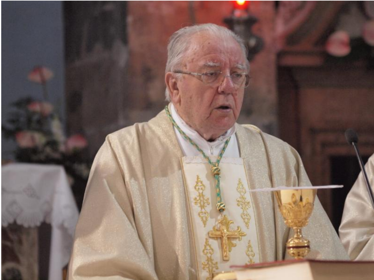
Svako otezanje kanonizacije Stepinca može samo koristiti

tijelom na nebo. Tu istinu naše vjere Pio XII. je proglasio koristeći svoje pravo nezabludivosti definirano na I. vatikanskom saboru. To je jedini slučaj takve definicije vjerskih istina. Pio XII. je u mnogočemu pripremio Drugi vatikanski sabor. On je pri pisanju svojih enciklika (okružnica) pitao najveće tadašnje teologe. Zato će se njegove enciklike o Svetom pismu i o liturgiji i dalje s posebnim uvažavanjem citirati. Ipak se može reći da se pri tome okružio zastupnicima tzv. rimske teologije, dok je na Drugom vatikanskom saboru došla do izražaja teologija koja se razvijala u Njemačkoj i Francuskoj. Bolji poznavatelji Pija XII. od mene kažu da stalne crkvene strukture mogu riješiti sva glavna teološko-pastoralna pitanja i bez sazivanja crkvenih sabora.