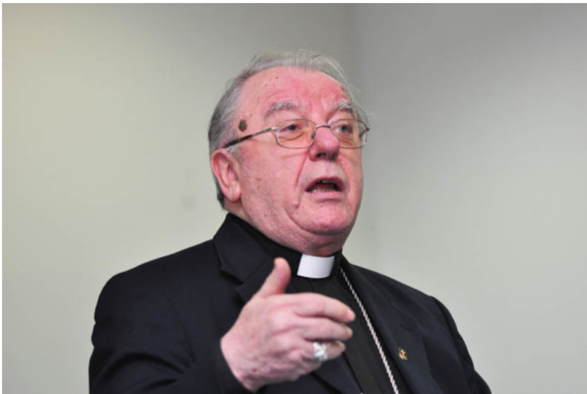
Pokažimo da smo „od stoljeće sedmog“ povijesno vezani uz Rim

Što se tiče pape Pija XII. ne treba ovim otvaranjem arhiva očekivati nešto bitno novo. Nakon što je objavljeno nekoliko knjiga kako je Pio XII. u vrijeme Drugog svjetskog rata šutke gledao zločine protiv čovječanstva, papa Pavao VI. je 1964. izdao dekret po kojem se dopušta objavljivanje spisa iz Vatikanskih arhiva za Drugi svjetski rat. Već 1965. započeo je jedan niz knjiga pod zajedničkim naslovom: „Sveta Stolica i Drugi svjetski rat“, iako još nije stiglo vrijeme za redovno otvaranje arhiva stručnjacima. Jednu od tih knjiga objavio je moj profesor sa Sveučilišta Gregoriana u Rimu. Znao nam je često govoriti o tim istraživanjima. Njegovu knjigu naslovljenu: „Pio XII. i Drugi svjetski rat prema Vatikanskim arhivima“ objavila je 2004. Kršćanska sadašnjost. Na stranicama od 176. do 179. govori se o prilikama u Hrvatskoj. Dakle, nekim crkvenim povjesničarima bilo je dostupno već odavno ono što je sada otvoreno i širem krugu istraživača. Razumljivo je da je svakoj ustanovi njezin arhiv uvijek dostupan. Jasno je također da će se u kilometarskoj građi naći i do sada nepoznatih dokumenata, ali do nekih većih obrata neće doći. Bit će uvijek onih koji će tražiti i u tim arhivima materijala kako bi optužili pred javnošću Pija XII. i Svetu Stolicu gradivom koje pronađu u njezinim arhivima. To se ne može spriječiti.