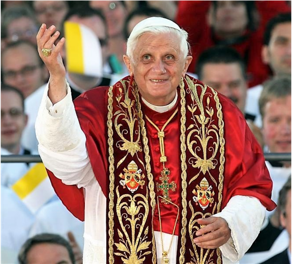
Sveti Otac Benedikt XVI.