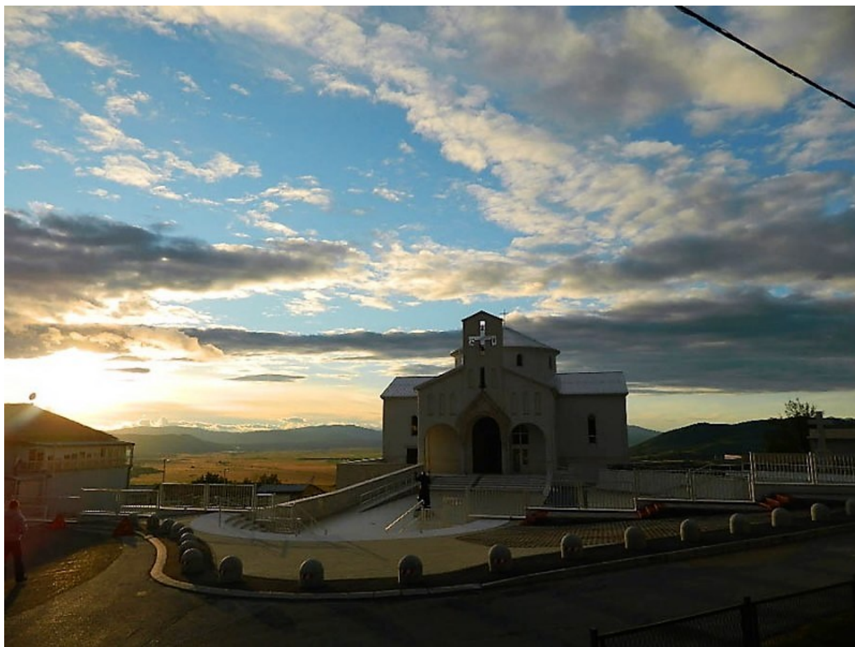
Crkva hrvatskih mučenika u Udbini

U petom, preposljednjem, nastavku feljtona o papi Piju XII. i Vatikanskom apostolskom arhivu umirovljeni biskup Gospičko-senjske biskupije mons. dr. sc. Mile Bogović (81), ujedno i crkveni povjesničar, s crkvene i povijesne strane osvjetlit će nam lik i djelo pape Eugenia Pacellija, odnosno Pija XII. Naravno, bit će riječi i o našem blaženiku kardinalu Alojziju Stepincu i procesu njegove kanonizacije, a kojega je upravo papa Pio XII. imenovao kardinalom. Biskup Bogović je, kao što znamo, najzaslužnija osoba za izgradnju Crkve hrvatskih mučenika u Udbini, u kojoj se, među ostalim, čuvaju i relikvije blaženog Alojzija Stepinca. Podsjetimo, biskup Bogović još je 2002. godine predstavio javnosti ideju o izgradnji Crkve hrvatskih mučenika u Udbini, nakon čega se projekt počeo polako razvijati, da bi već 2010. godine crkva bila dovršena. Zamišljena je kao skupno mjesto svih hrvatskih stradanja i muke hrvatskog naroda do ostvarenja svoje države i slobode. Crkva je svečano otvorena i blagoslovljena 11. rujna 2010. godine u nazočnosti više od 15 000 hodočasnika, a misno slavlje predvodio je vrhbosanski nadbiskup i metropolit kardinal Vinko Puljić. Riječ je o najvećoj crkvi na Udbini, ujedno i hrvatskom nacionalnom svetištu.