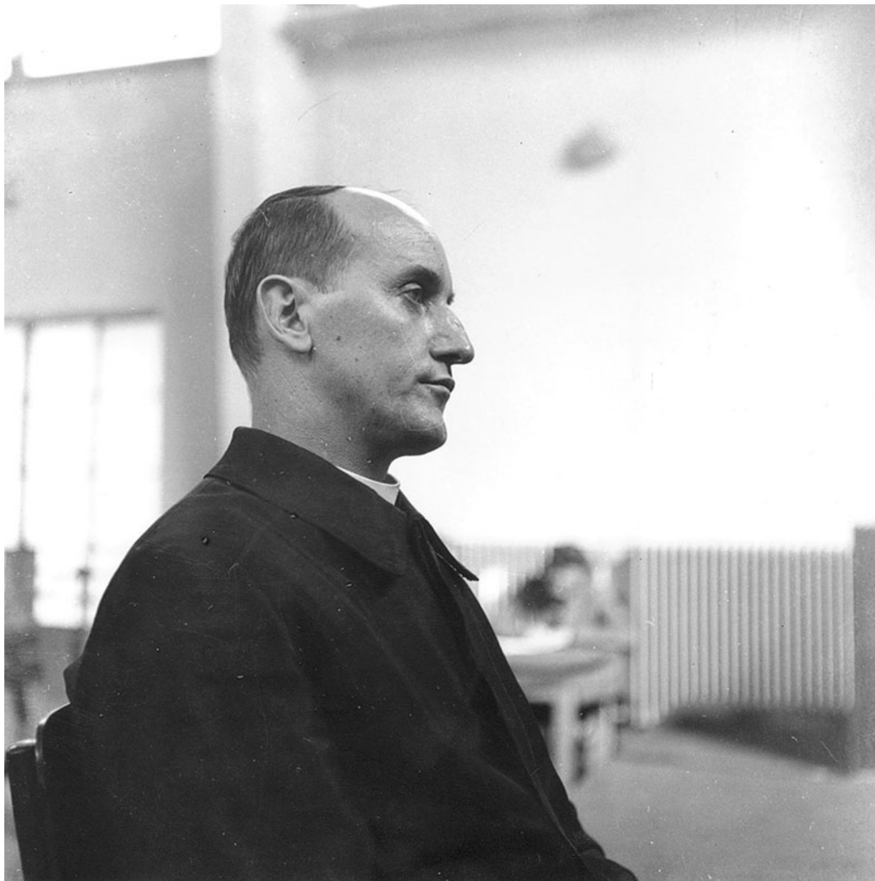
Nadbiskup Alojzije Stepinac na suđenju u montiranom procesu