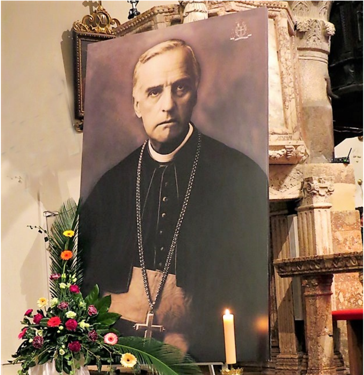
Ove godine obilježava se stota obljetnica smrti krčkog biskupa Antuna Mahnićća

Ove godine obilježavamo stotu obljetnicu smrti velikog krčkog biskupa, utemeljitelja i organizatora Hrvatskog katoličkog pokreta - Antuna Mahnićća. On je već na prijelazu iz 19. u 20. stoljeće dobro pročitao kakvu opasnost svijetu donosi liberalizam. On je poticao razvoj relativizma u odnosu prema svim kršćanskim i humanističkim zasadama, pa i prema istini. Liberalizam lako mijenja kapute pa jednom uzme komunistički, jednom fašistički, jednom jugoslavenski, jednom bez zastave, ali vodi prema relativizaciji kršćanskih zasada, a kako u novije vrijeme vidimo (rodna ideologija) i ljudskih zasada. Bilo bi korisno kad bi ova Mahniććeva obljetnica pokrenula prečitavanje Mahniććevog spisateljskog djela o liberalizmu.