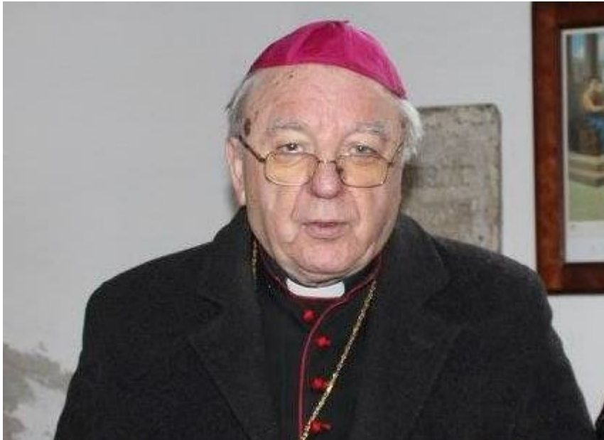
Danas se znanstvenim radom mnogo više bavim nego prije

živjeti bez funkcija. U toj školi dosta sam napredovao tako da mogu (besplatno) „davati sate“ pouke onim biskupima koji će skoro odložiti dosadašnje funkcije. I poruka na kraju: mislim da je u našem narodu premalo onih kojima ostaje vremena - nakon obiteljskih zadaća i obveza na radnom mjestu - da rade i za one međuprostore u društvu koje se ne vidi ni iz obiteljske kuće ni s radnog mjesta. Ima takvih ljudi, ali slabo su organizirani. Ja sam to uvijek imao na umu i tom zadatku posvećivao i posvećujem dobar dio svoga vremena i snaga. Pokrenuo sam tu inicijativu i u Gospiću. Iako nije bilo opipljivog rezultata, mislim da se nisam uzalud trudio - zaključio je umirovljeni gospićko-senjski biskup mons. dr. sc. Mile Bogović.