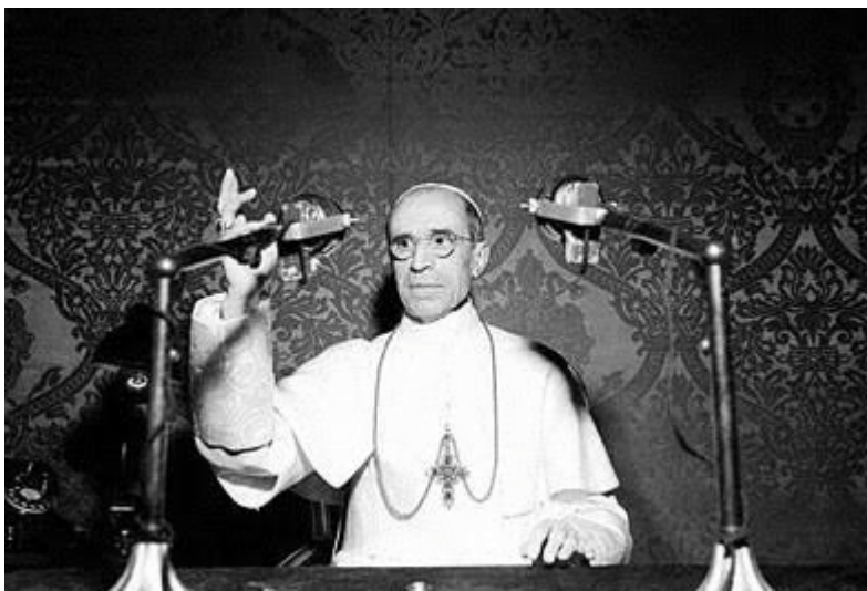
Sveti Otac Pio XII. upućuje radio-poruku vjernicima

Dakle, mi kršćani, katolici, pripravnici smo na te napade, očekujemo ih jer su neizbježni, svakodnevno se s njima susrećemo. No, nerijetko i odgovorimo na te napade, argumentirano, jasno, a opet ne istom mjerom, već s dozom kršćanske ljubavi prema bližnjem. Koliko god nam teško bude u tom trenutku, oprostimo onima koji nas lažno i bez argumenata napadaju i idemo dalje. Često sam se i prije ovoga sadašnjeg posla na HKM-u susretao s takvim osobnim napadima na mene zbog mojih vjerskih uvjerenja od strane nekih kolega, no nisam zlopamtilo. I danas se sporadično znaju javiti kritizeri Crkve, uglavnom s liberalno-ateističkih pozicija, ali i s druge strane, vjerskih fundamentalističkih pozicija koje također ne treba podcijeniti. No to je sve dio ovoga posla, i života vjernika općenito.