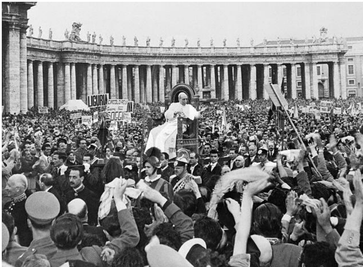
Papa Pio XII. u susretu s hodočasnicima