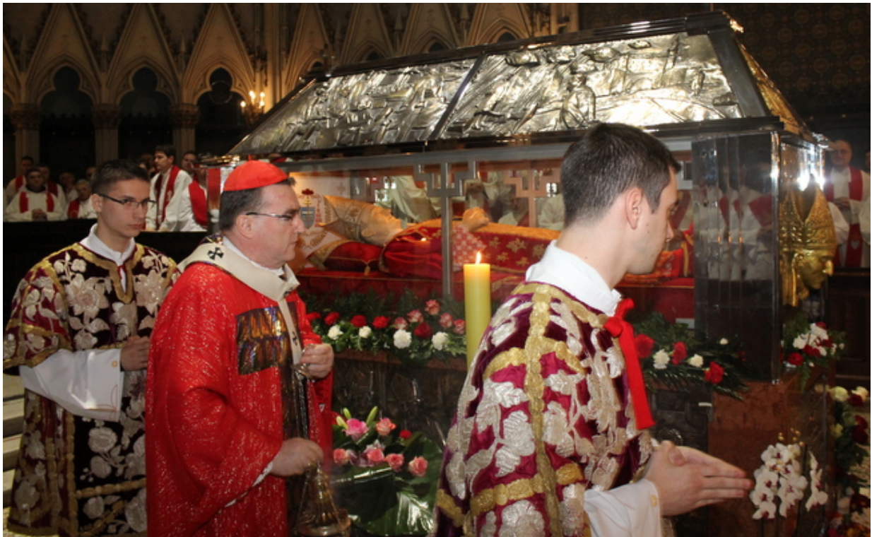
Grob kardinala bl. Alojzija Stepinca u zagrebačkoj katedrali / Foto: Zagrebačka nadbiskupija

- Za sve građane je ovo izvanredna situacija, pa je tako izvanredna i za nas iz medija. Mnogo toga se promijenilo, rasporedi, uhodani poslovi, sve se sada prilagođava trenutnoj situaciji s pandemijom. Ovisno o mjerama Nacionalnog stožera civilne zaštite, tako i mi prilagođavamo naš posao i zadatke u redakciji. Ipak, zdravlje naših ljudi i gostiju je na prvom mjestu. Dio ekipe radi od kuće, oni koji imaju uvjete i koji mogu raditi od kuće da posao ne trpi. Oni koji moraju biti u redakciji, tu su, naravno mnogo nas je manje u prostorijama HKM-a, ali zasad posao funkcionira. Sve stižemo, krpamo se nekako. Naravno, svi se nadamo da će sve ovo što prije završiti da se vratimo u normalu.