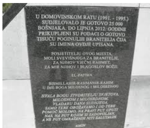
Spomenik Bošnjacima poginulim u Domovinskom ratu

Ovome dodajmo kako je prema riječima Nusreta Seferovića , predsjednika Udruge Roma branitelja iz Domovinskog rata, broj poginulih Roma između 30 i 50. Takvih slučajeva najviše je bilo u Belome Manastiru, Iloku i Belišću. Romski branitelji bili su uključeni u sve veće akcije, dok je najveći broj djelovao na područjima Sisačko-moslavačke, Ličko-senjske, Brodsko-posavske, Karlovačke, Osječko-baranjske županije te na području Zagreba i Zagrebačke županije.